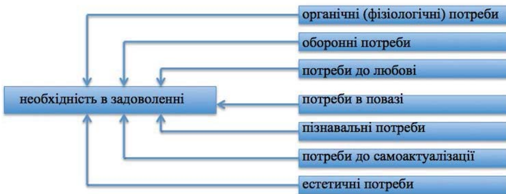
Рис. 1. Класифікація первинних і вторинних мотивацій відповідно до типів діяльності, до яких спонукають ці мотивації

Наприклад, під час формування плану дії доводиться так чи інакше прораховувати багато варіантів (гілки графа цілей) та оцінювати їх перевагу. У підсумку такої діяльності формуються